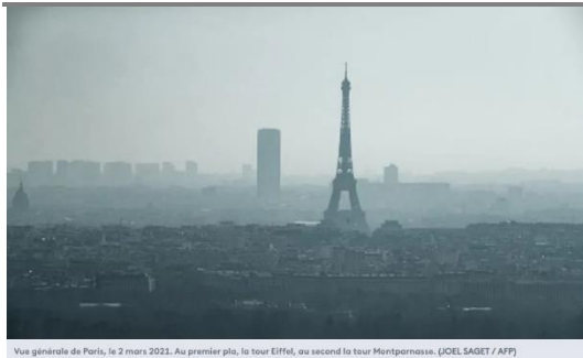
Vue générale de Paris, le 2 mars 2021. Au premier plan, la tour Eiffel, au second la tour Montparnasse.